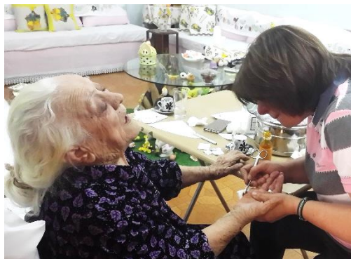
« Beit-Anya », un des projets soutenus par Basmat al-Qarib

Votre geste redonne le courage de vivre à ceux et celles qui n'ont plus la force d'espérer.